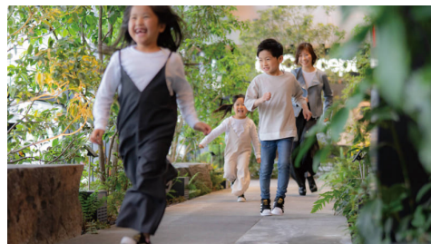
「社のななふしぎ」 Exhibition アミューズザくまもと