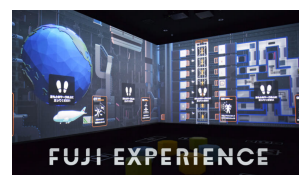
「FUJI EXPERIENCE」 Exhibition/Movie 不二輪送機工業