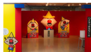
「あそびのがっこうハイタッチスクール」 Exhibition 博多大丸福岡天神店