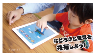
「Mr.shapeのタッチカード」 Application ©KOO-KI