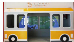
Zoolab 「どこからバス」「くるくるひょうほん」 「ZooTuber」 Exhibition 福岡市動物園