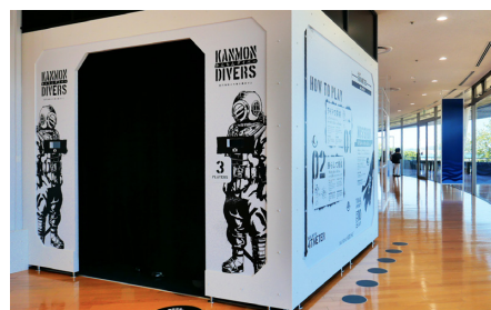
「かんもんダイバー」 Exhibition 北九州市関門海峡ミュージアム