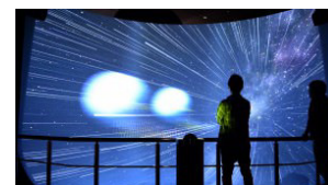
Nikon Museum 「Universe of Nikon ニコンがひらく世界」 Exhibition Nikon