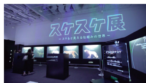
「スケスケ展」 Exhibition 福岡市科学館 / 西日本新聞社 / RKB毎日放送