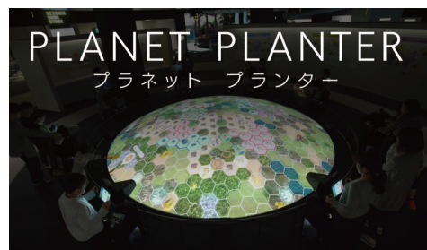
「プラネットプランター」 Exhibition 福岡市科学館