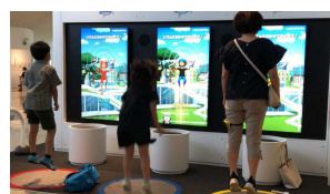
「スペースジャンプ」 Exhibition 小松村田製作所